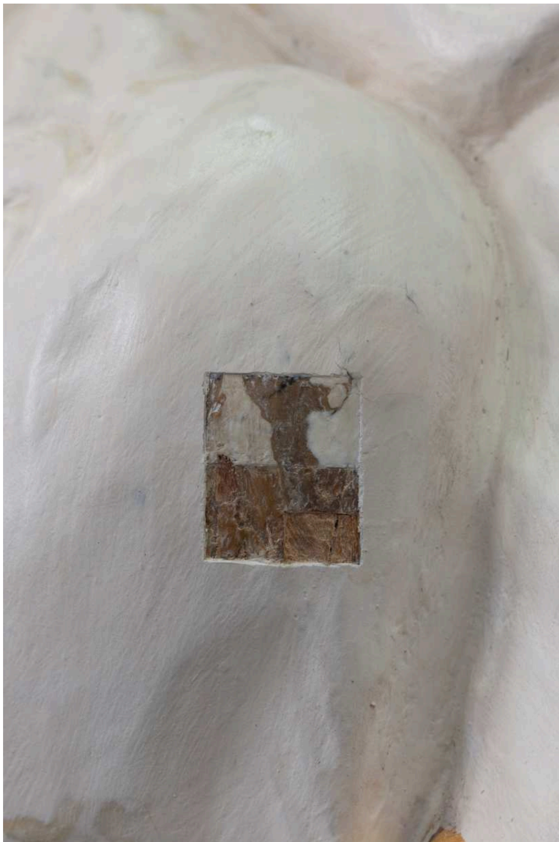
S02 - zkouška snímání mladších barevných úprav - atribut - hlava ryby