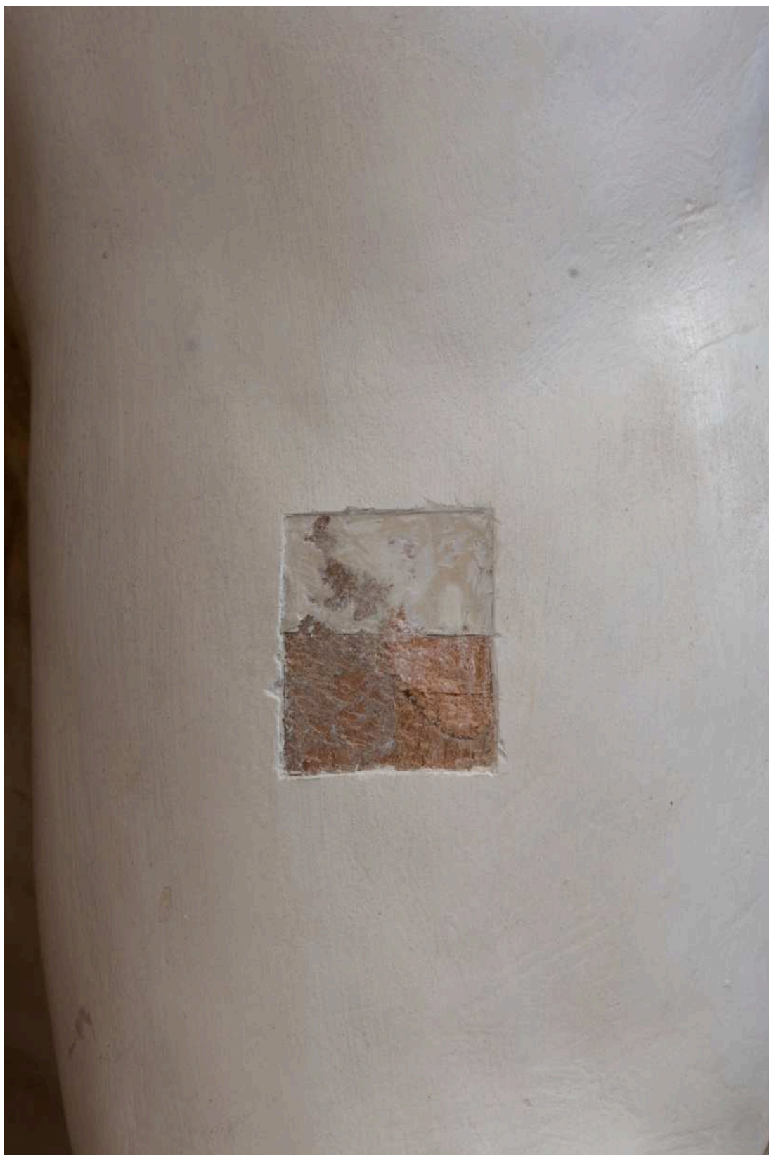
S01 - zkouška snímání mladších barevných úprav - pravá paže Archanděla