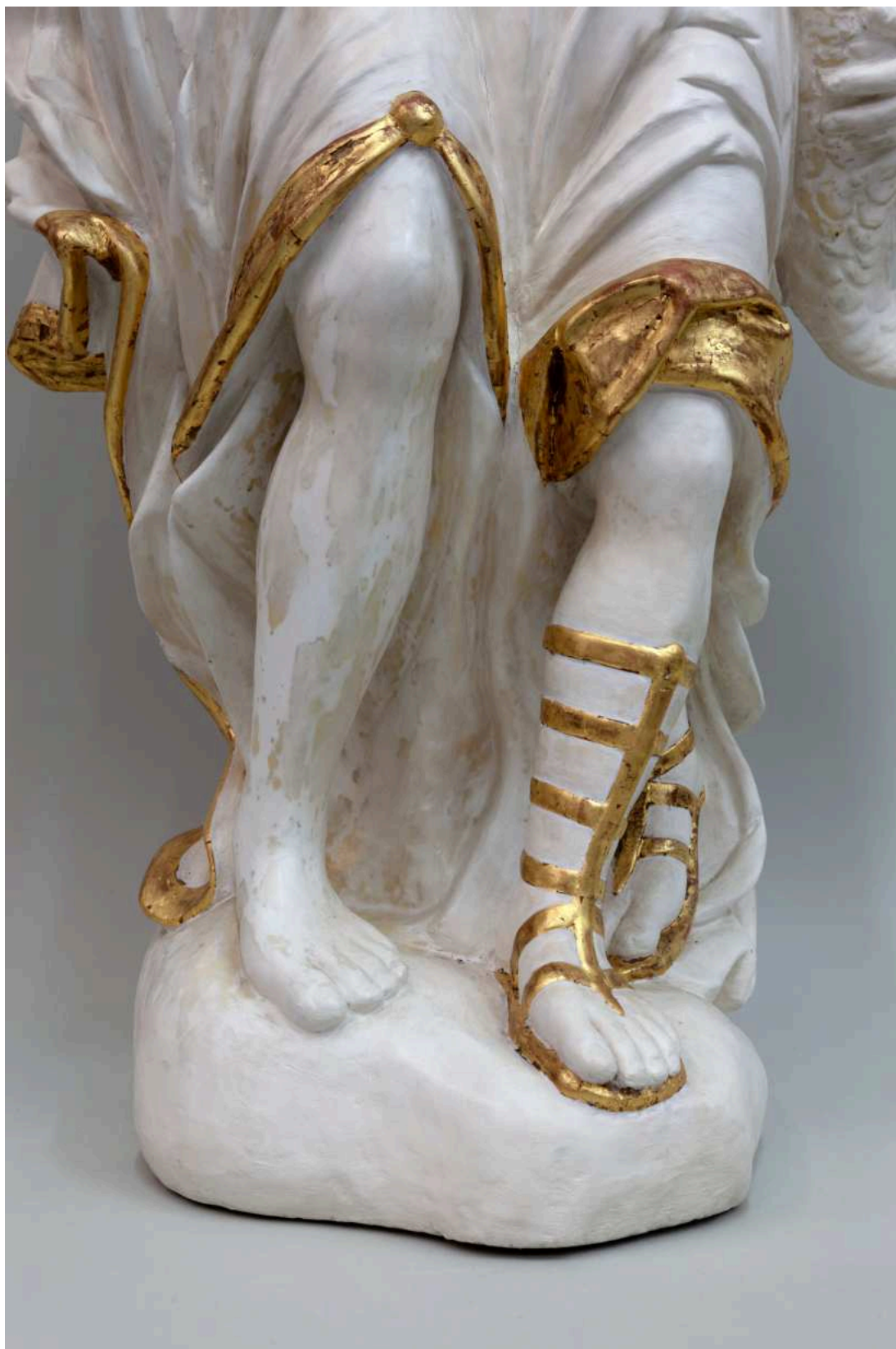
Stav před restaurováním - nakročené levé nohy