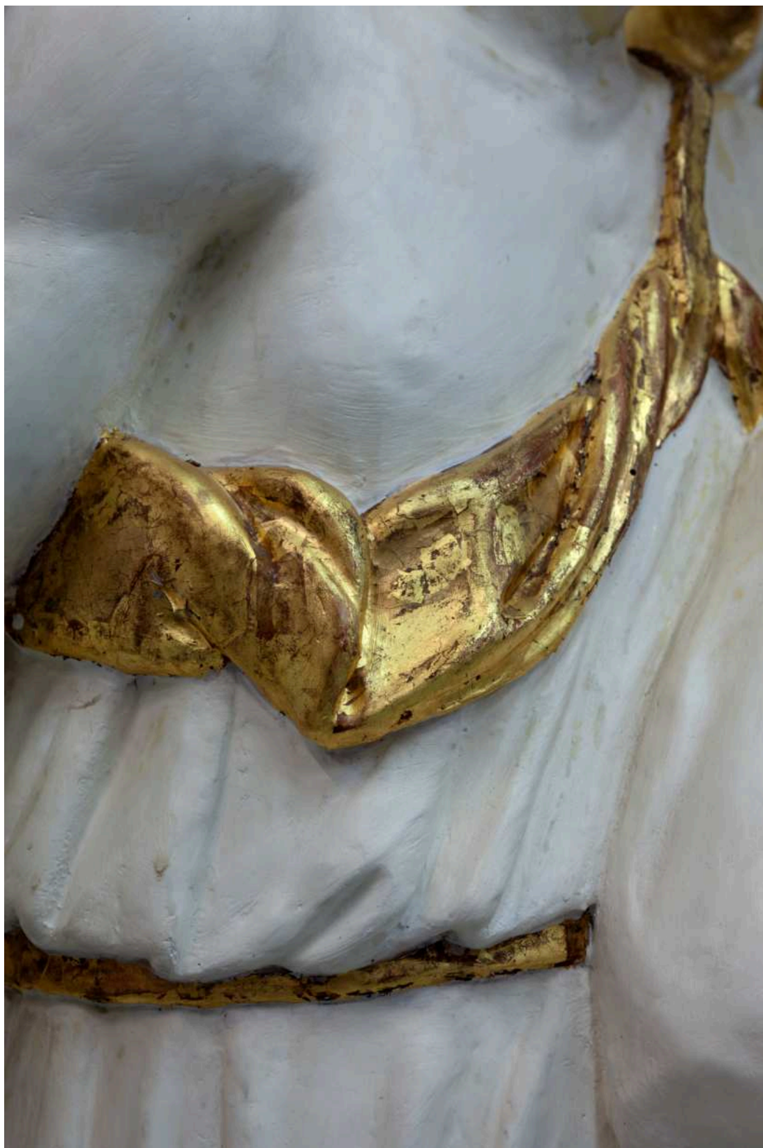
Stav před restaurováním - zlacení drapérie tuniky