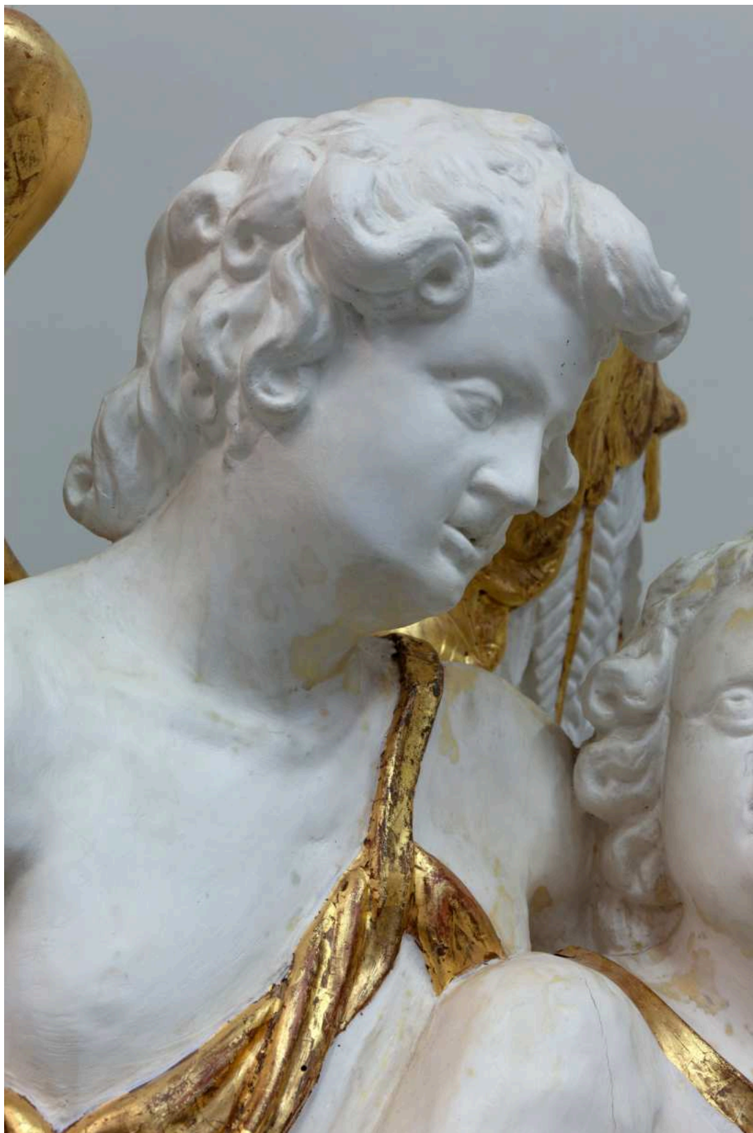
Stav před restaurováním - hlava Archanděla Rafaela