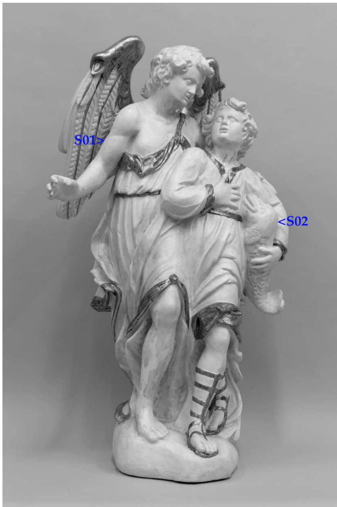
Umístění zkoušek snímání mladších barevných úprav