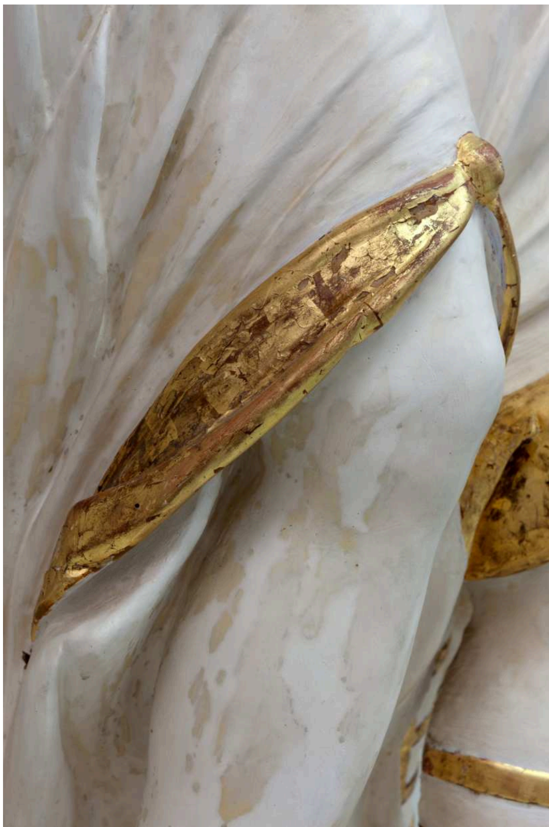
Stav před restaurováním - abrazivní poškození polychromie