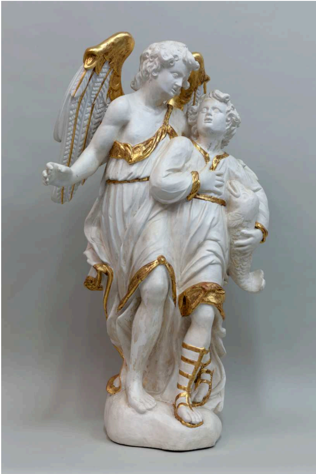
Stav před restaurováním - celkový pohled