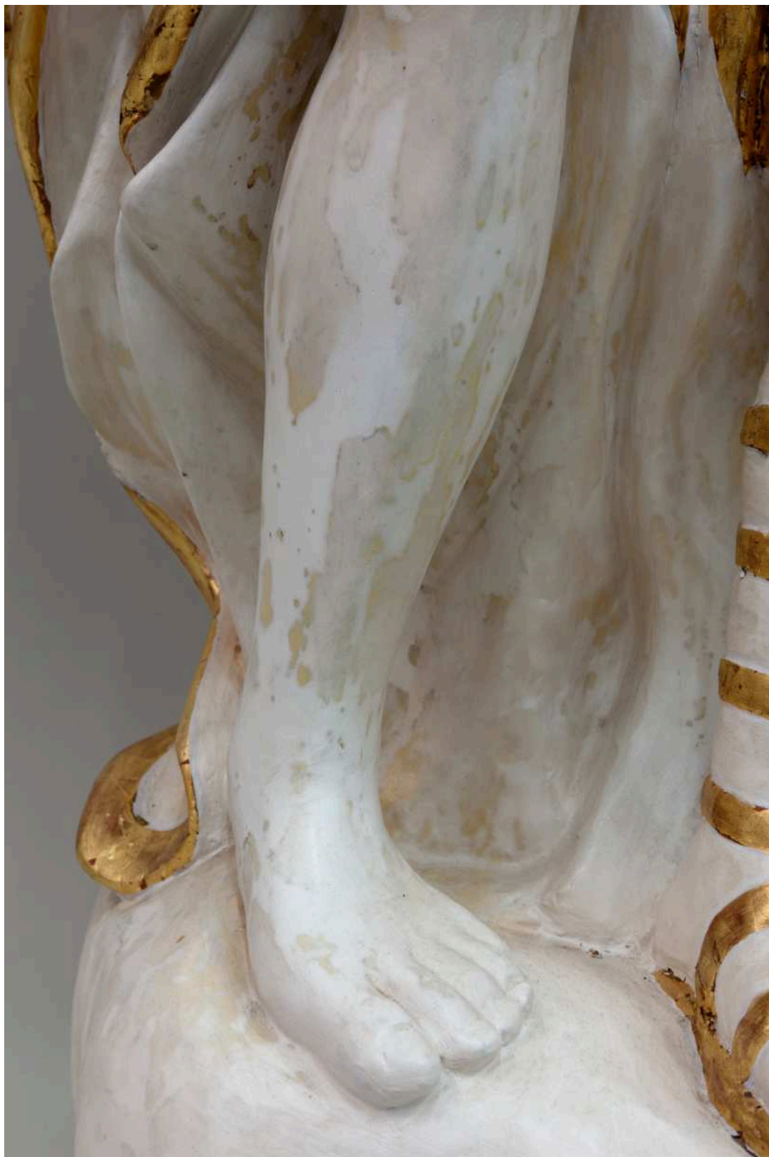
Stav před restaurováním - abrazivní poškození polychromie